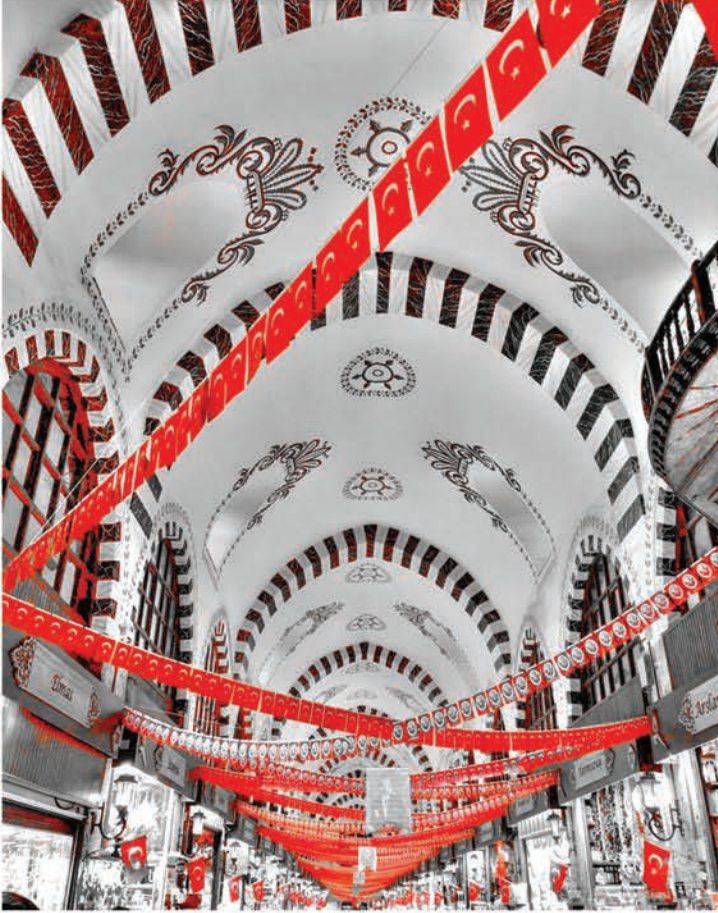
"100. Yıl Coşkusu" 2023

1989 yılında Mimar Sinan Üniversitesi Güzel Sanatlar Fakültesi'nde lisans eğitimini bitirerek, aynı yıl anılan üniversiteden "Öğretmenlik Formasyon Belgesi" aldı. 1995 yılında Marmara Üniversitesi Atatürk Eğitim Fakültesi İlköğretim Bölümü Sınıf Öğretmenliği Ana Bilim Dalı'nda öğretim görevlisi kadrosuna atandı. 2019 yılında Doçentlik unvanını alarak halen bu görevini sürdürmektedir. Ulusal ve uluslararası kongre ve sempozyumlara katılarak eğitim, kültür, sanat tarihi, sanat eğitimi alanlarında bildiriler sundu. Çok sayıda ulusal ve uluslararası karma sergilere, Radyo ve TV programlarına katıldı. Diğer taraftan, yazı işleri müdürlüğü, sanat danışmanlığı ve bilim-hakem kurulu üyelikleri devam etmektedir. Marmara Üniversitesi Atatürk Eğitim Fakültesi'nin düzenlediği programlarda, Fakültenin Türk Sanat Müziği Koro Konserlerinde ve diğer kurum-kuruluşlarda sunuculuk-seslendirme yapmaktadır.