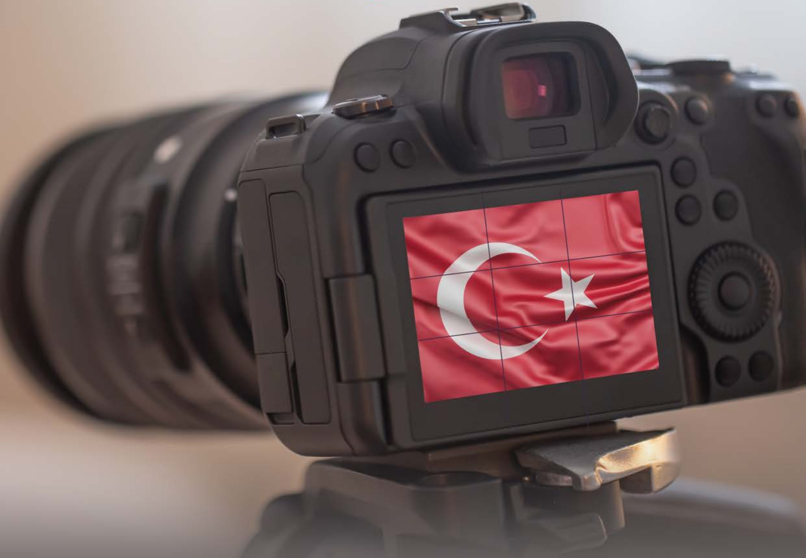
PHOTO EXHIBITION in the 100th Anniversary of the Republic of Turkey "Turkish Flag"

EMIDWORLD'23 International Congress Exhibition